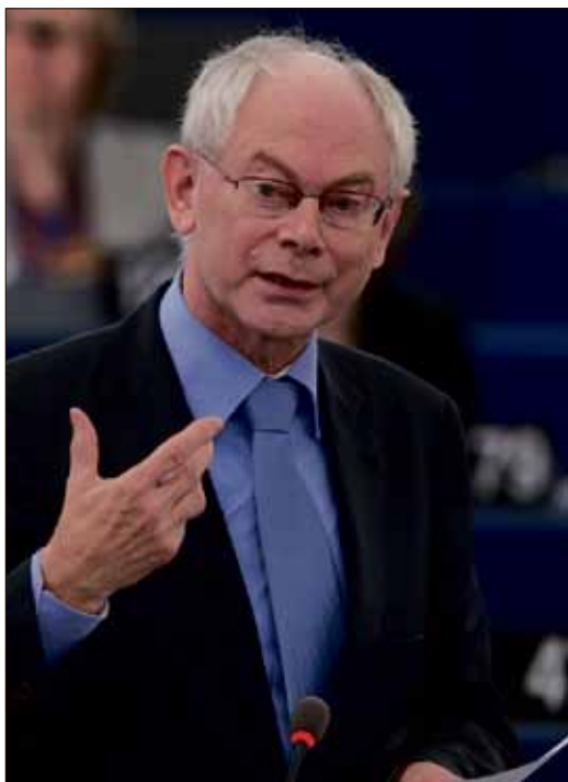
Herman Van Rompuy från Belgien är EU:s första president.