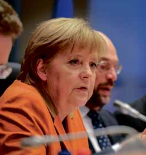
Tysklands förbundskansler Angela Merkel på ett EU-möte.