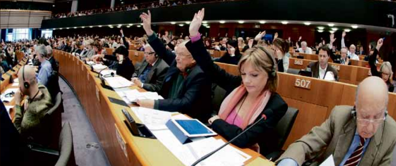
Europaparlamentet sammanträder i Strasbourg och i Bryssel.