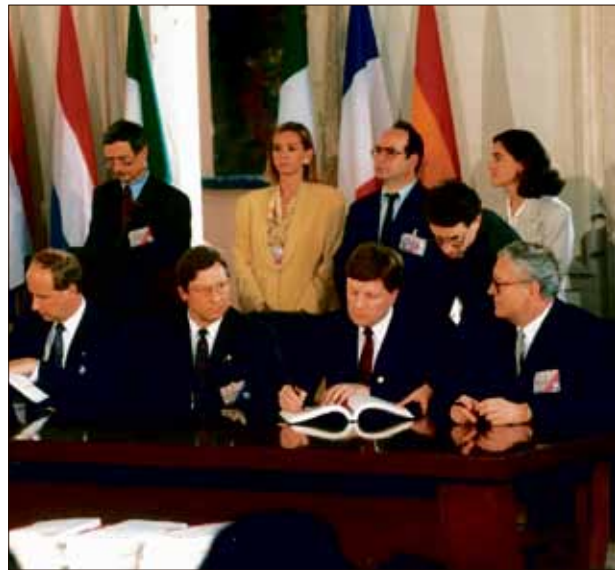
Finland gick med i Europeiska unionen år 1995. På bilden undertecknar Finlands representanter avtalet.

Innan Finland gick med i EU ordnade man en folkomröstning om Finlands medlemskap i EU. I folkomröstningen ville största delen eller 56,9 procent av finländarna gå med i EU.