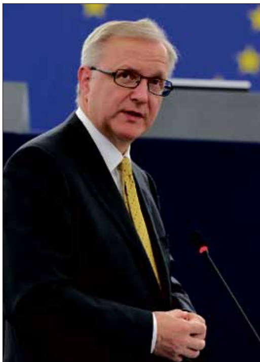
Finländaren Olli Rehn är Europeiska kommissionens viceordförande.