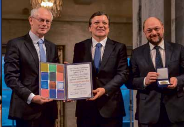
EU:s representanter tog emot Nobels fredspris 10.12.2012.