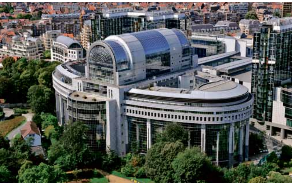
Europa-parlamentet finns i den här byggnaden i Bryssel.